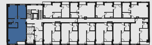
s c h é m a p ô d o r y s u 1 . N P / s c h e m e o f t h e f i r s t f l o o r