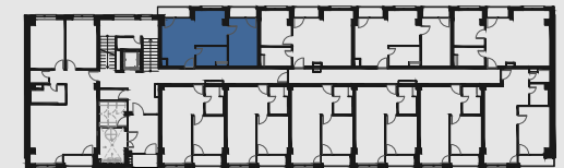
s c h é m a p ô d o r y s u 1 . N P / s c h e m e o f t h e f i r s t f l o o r