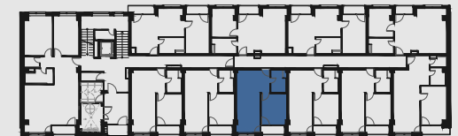
s c h é m a p ô d o r y s u 1 . N P / s c h e m e o f t h e f i r s t f l o o r