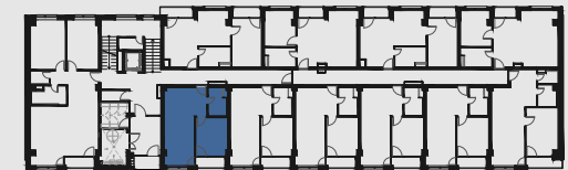
s c h é m a p ô d o r y s u 1 . N P / s c h e m e o f t h e f i r s t f l o o r