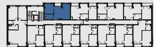
s c h é m a p ô d o r y s u 2 . N P / s c h e m e o f t h e s e c o n d f l o o r