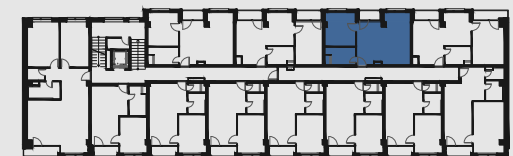
s c h é m a p ô d o r y s u 2 . N P / s c h e m e o f t h e s e c o n d f l o o r