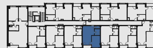
s c h é m a p ô d o r y s u 2 . N P / s c h e m e o f t h e s e c o n d f l o o r