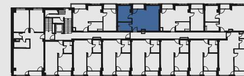
s c h é m a p ô d o r y s u 3 . N P / s c h e m e o f t h e t h i r d f l o o r