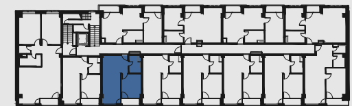
s c h é m a p ô d o r y s u 3 . N P / s c h e m e o f t h e t h i r d f l o o r